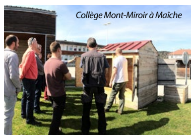
Collège Mont-Miroir à Maïche

Préval a participé pour la première fois à l'événement national Tous au compost , en vendant notamment 203 composteurs :