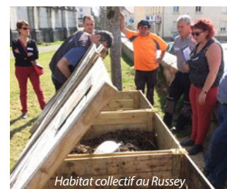
Habitat collectif au Russey

>> Visionnez l'action en vidéo en cliquant ici !