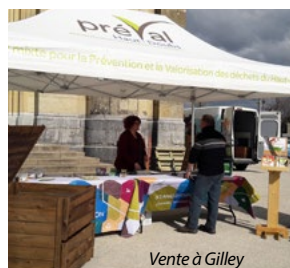
Vente à Gilley

de vente de composteurs et conseils pratiques