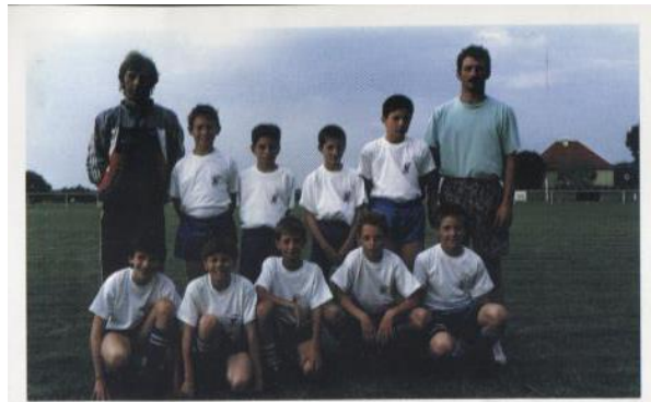
Bethoncourt - 20 juin 93 - Les Pupilles sont Champions de Franche-Comté...