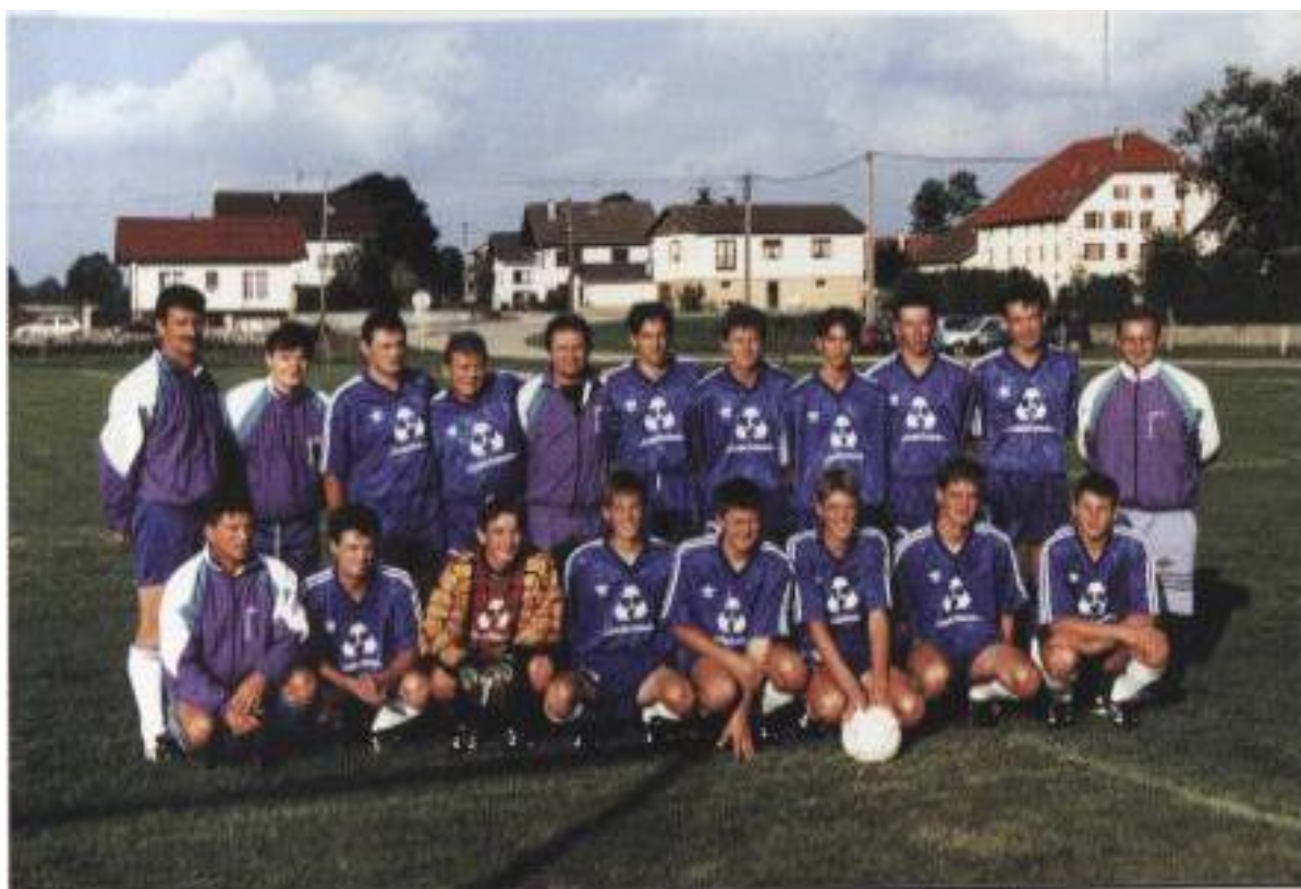
L'Equipe Seniors 95/96 avec l'encadrement.

Le 12 juin 1999, l'ASNCC décide de créer une 2 ème équipe senior au club. Celle-ci jouera donc en 4 ème division et l'équipe A en 2 ème division.