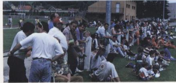
... vivement encouragés par leur public.