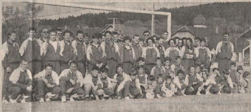
Les licenciés du club avec l'encadrement

Ce sont à des petits détails que l'on mesure la grandeur d'un club. Réunis pour une fête de fin de saison offerte par les joueurs seniors, les jeunes footballeurs ont offert chacun une rose à leur maman pour la fête des Mères. Un geste simple mais chaleureux qui a donné d'entrée de jeu le ton à la soirée qui se déroulait sur le gazon du stade.